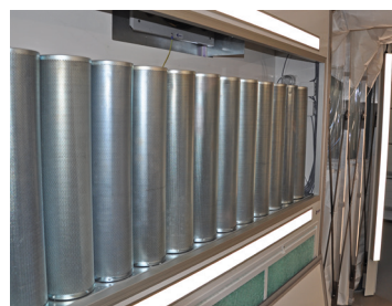
Af hensyn til arbejdsmiljøet er filtrering af luften alfa og omega i de mobile kabiner, hvor lakskader udbedres.